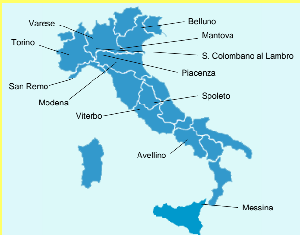
Figura 1. Distribuzione geografica delle CT partecipanti

Sono stati analizzati i dati relativi a 118 utenti DD in carico a 12 CT con programma specialistico per DD (Figura 1).